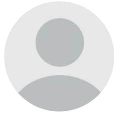
Emin Mirbatur SEVAL

Bangladeş'te 5 Ağustos 2024 tarihinde kota reformu talep eden büyük ve kanlı öğrenci ayaklanmalarından sonra Şeyh Hasina'nın on beş yıllık iktidarı düşmüştür. Bu gelişme, Bangladeş'in siyasi tarihinde önemli bir kırılma noktası olmuş ve devrilen hükümetin yerine geçici bir hükümet kurulmuştur. Şeyh Hasina iktidarının düşmesinden sonra Bangladeş'te geçici hükümetin başına 2006 yılında Nobel ödülünü almış, Şeyh Hasina hükümetinin devamlı eleştirmeni olan Muhammed Yunus geçmiştir. Muhammed Yunus, mikrokredinin öncüsü olarak bilinmektedir ve Grameen Bankası'nın kurucularındandır. Söz konusu banka, mikrokrediler üzerine yoğunlaşmıştır ve yoksullara teminat gerektirmeyen mikrokrediler vermektedir.