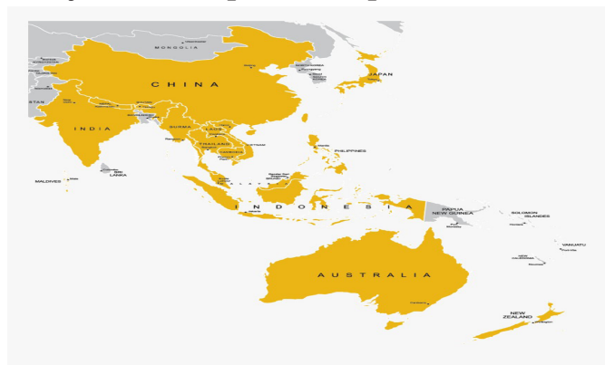
Рисунок 1- Карта Австралии

Еще одно важное заявление, подчеркивающее важность Индо-Тихоокеанского региона для Австралии, сделал Питер Варгезе, бывший верховный комиссар Австралии в Индии. 6