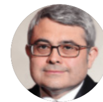
Ahmet Bülent MERİÇ Посол в отставке

Отметив, что переговоры имеют экономическое значение для России, Нагао сказал: Япония является потребителем российских энергоресурсов. Это может дать России преимущество в сделке с Китаем по ценам на энергоносители. Так что мирные переговоры с Японией оказались выгодными для России. Однако в текущей ситуации расширение торговли между Японией и Россией не представляется возможным из-за санкций.