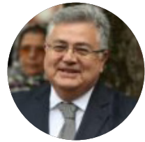
Hüseyin DİRİÖZ Посол в отставке

Аскероглу подчеркнул, что среди госчиновников в России нет единого мнения по поводу операции, и заявил, что неизвестно, в каком направлении пойдет процесс в сложившейся ситуации. Комментируя заявление Запада о санкциях против России, Аскероглу сказал главное здесь в том, хотя ли Соединенные Штаты (США) на самом деле наказать Москву в результате вмешательства России в Украину? Если США действительно этого захотят, то никакого обращения к дипломатии не будет. В противном случае Россия заманила бы себя в ловушку однако объявленные Западом санкции не остановят Москву. Шагом, который сдержит Кремль, станет значительное перевооружение украинской армии. Некоторые шаги в этом направлении предпринимаются.