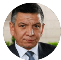
Coşkun BAŞBUĞ Полковник в отставке