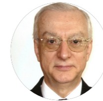
Uluç ÖZÜLKER Посол в отставке

Наконец, отметив, что членство Финляндии в НАТО откроет двери в другой период, Огуз предположил, что членство проложит путь к опасной гонке вооружений.