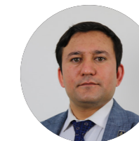
Ahmad Khan DAW-LATYAR

Министр иностранных дел Китая Ван И принял участие в встрече министров иностранных дел Организации исламского сотрудничества, организованной Пакистаном в качестве специального гостя, и выступил на встрече с речью об отношениях Китая с исламским миром. После этого Ван посетил Кабул и встретился с официальными лицами талибов. Во время встречи Ван пригласил министра иностранных дел талибов Амир Хана Муттаки на встречу, которая будет организована Китаем. Помимо Таджикистана, Узбекистана, Туркменистана, Пакистана, Ирана и Китая, на встрече также присутствовали министры иностранных дел России, Катар и Индонезии. В дополнение к этому была проведена встреча расширенной тройки, организованная Китаем, в составе специальных представителей Китая, России, Соединенных Штатов Америки (США) и Пакистана в Афганистане.