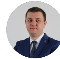
Cenk TAMER Эксперт АНКАСАМ по Азиатско-Тихоокеанскому региону